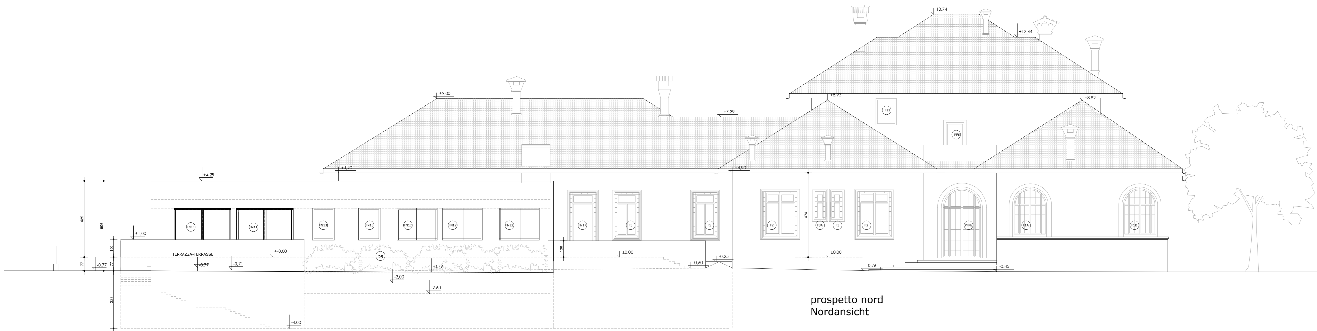
prospetto nord Nordansicht