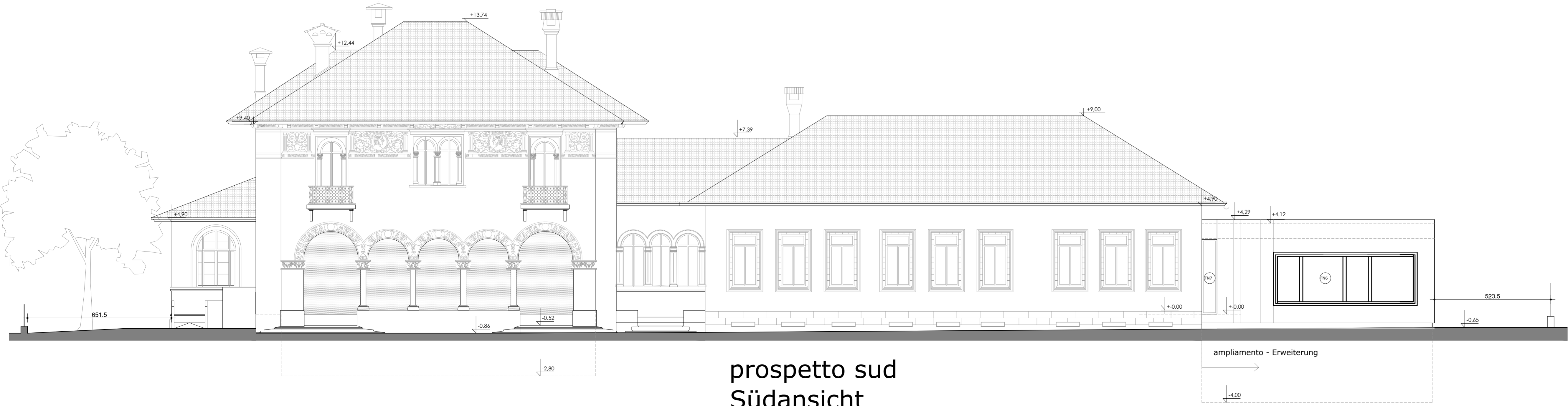
prospetto sud Südansicht